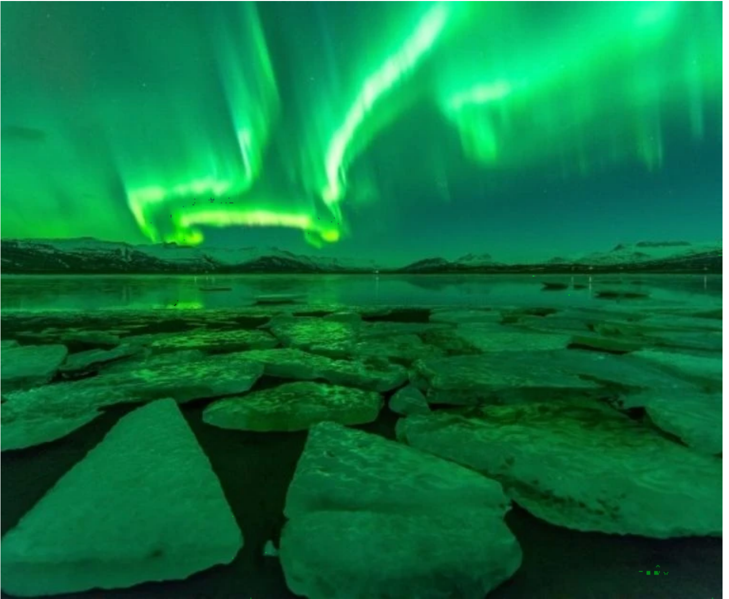
Aurores boréales au-dessus de Jokulsarlon