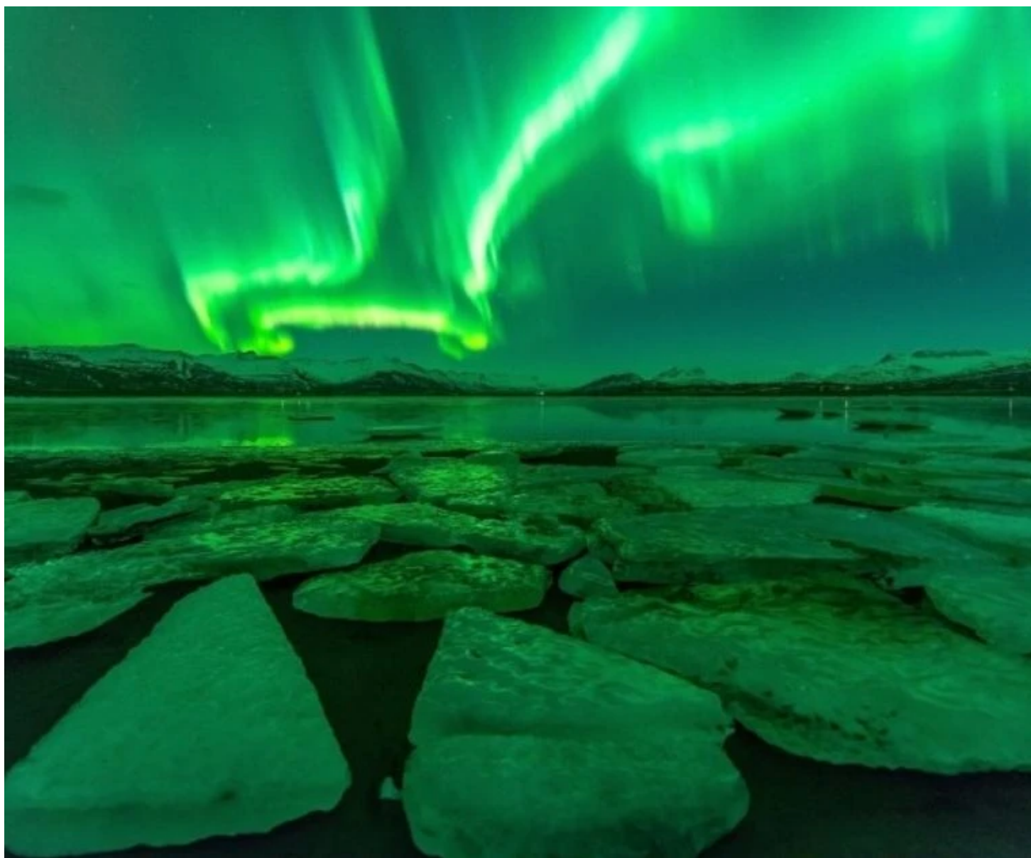
Aurores boréales au-dessus de Jokulsarlon