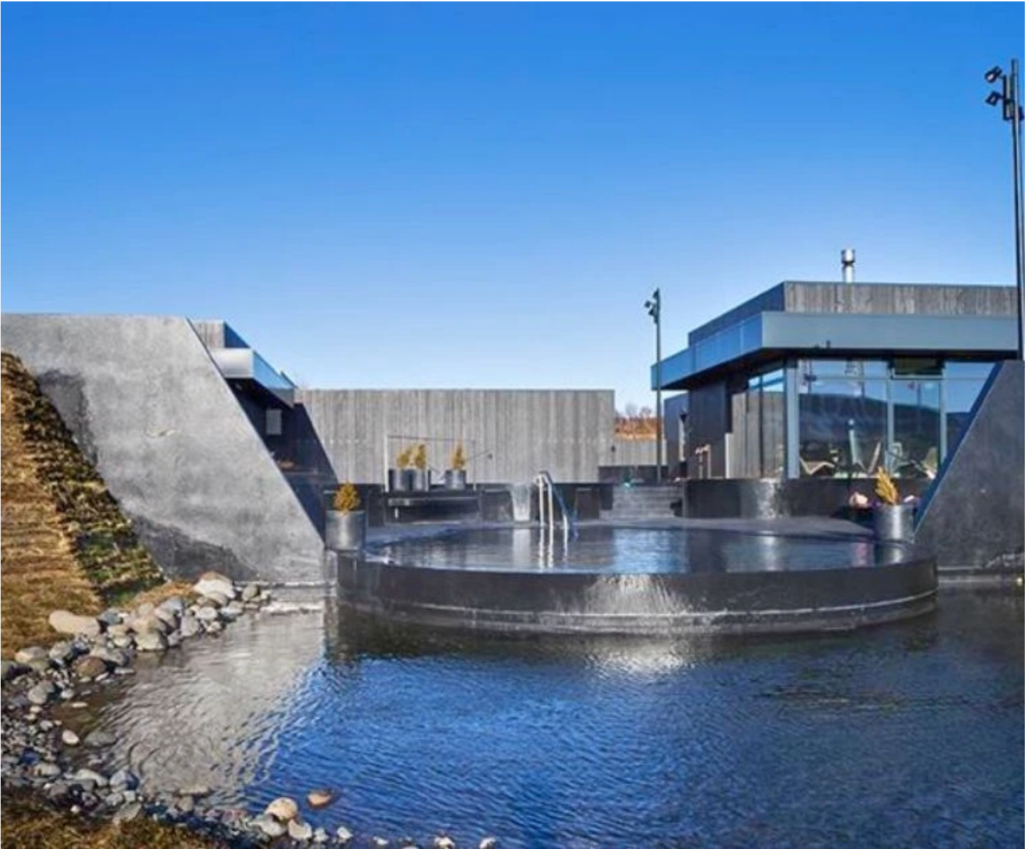
Krauma Nature Baths