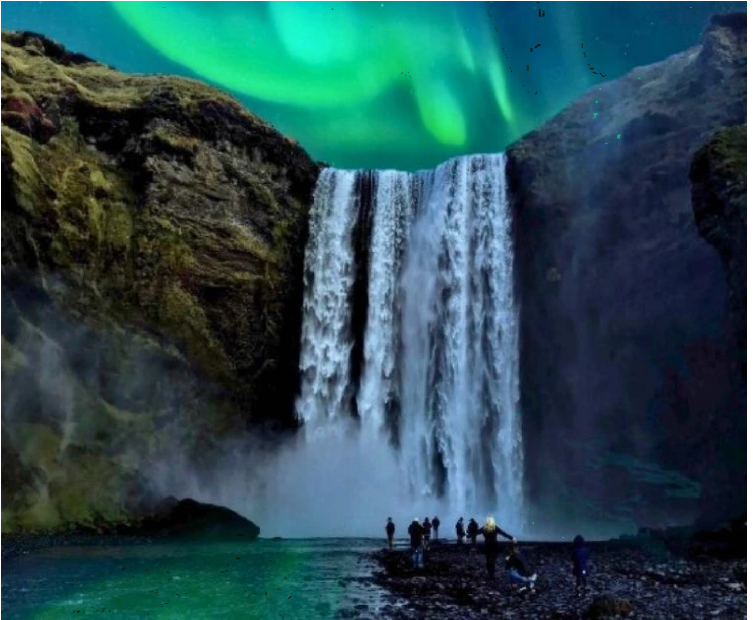
Skogafoss sous les aurores