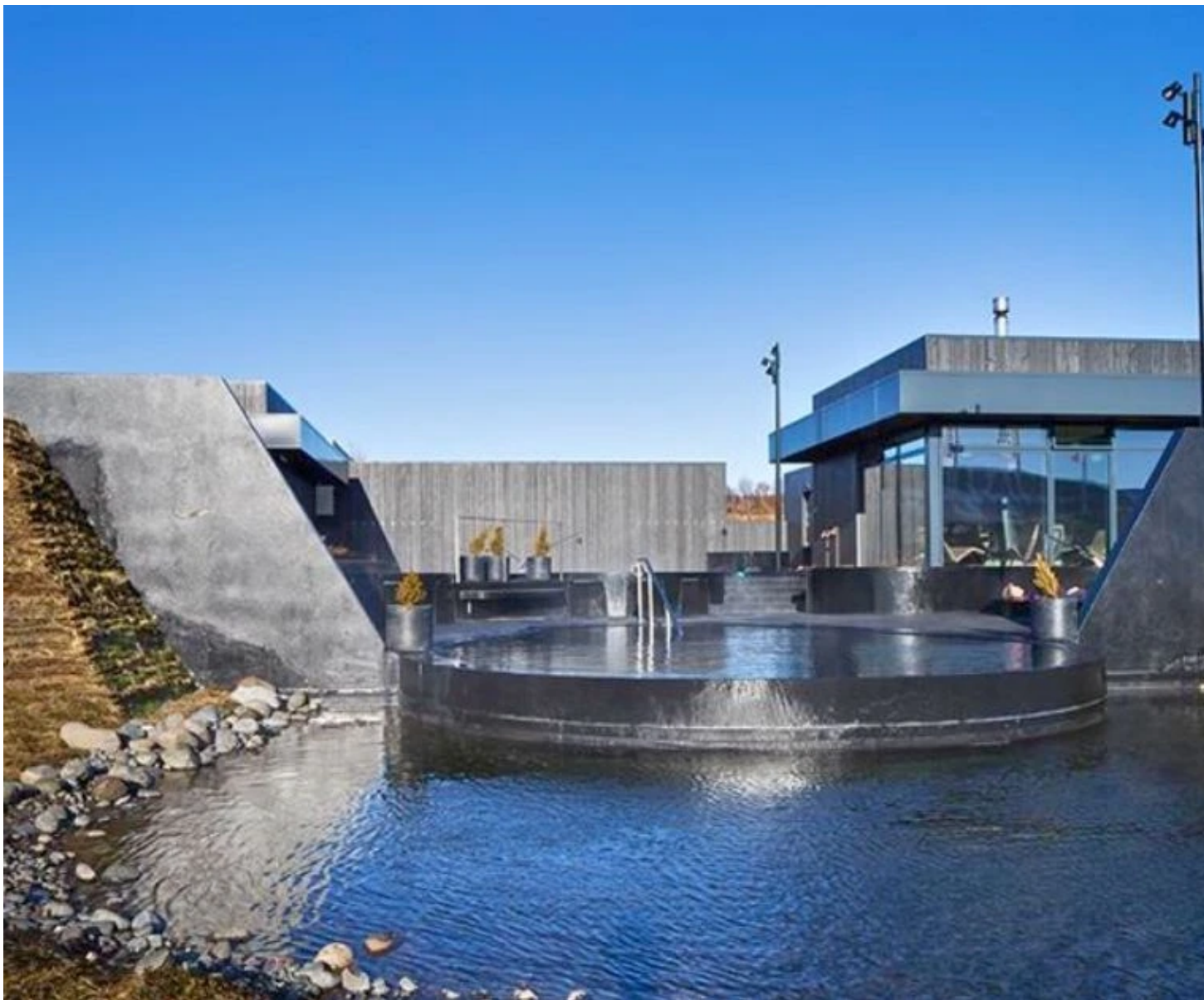
Krauma Nature Baths