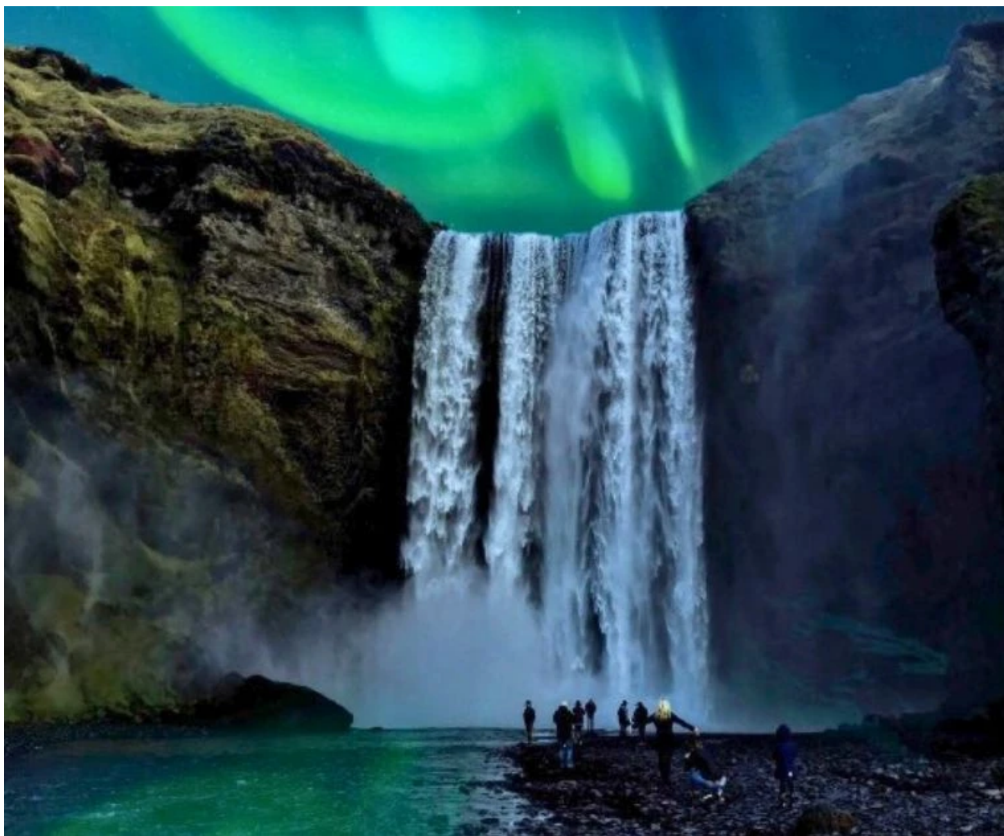
Skogafoss sous les aurores