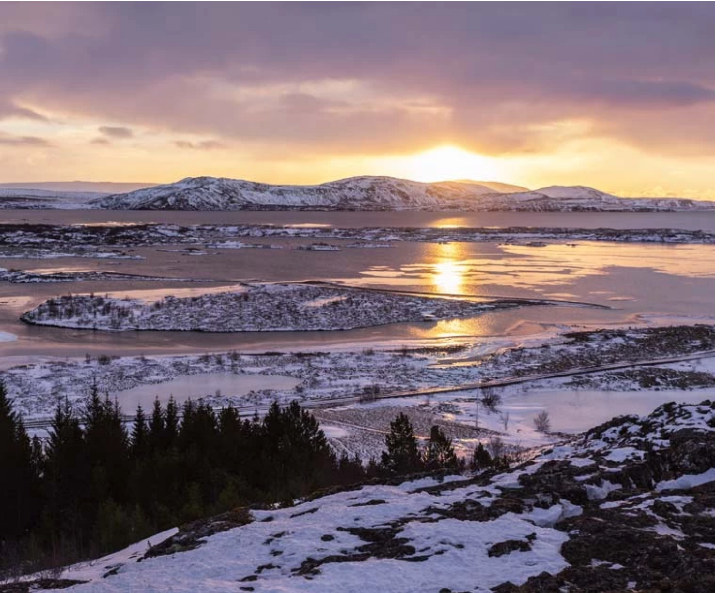
Parc national de Thingvellir