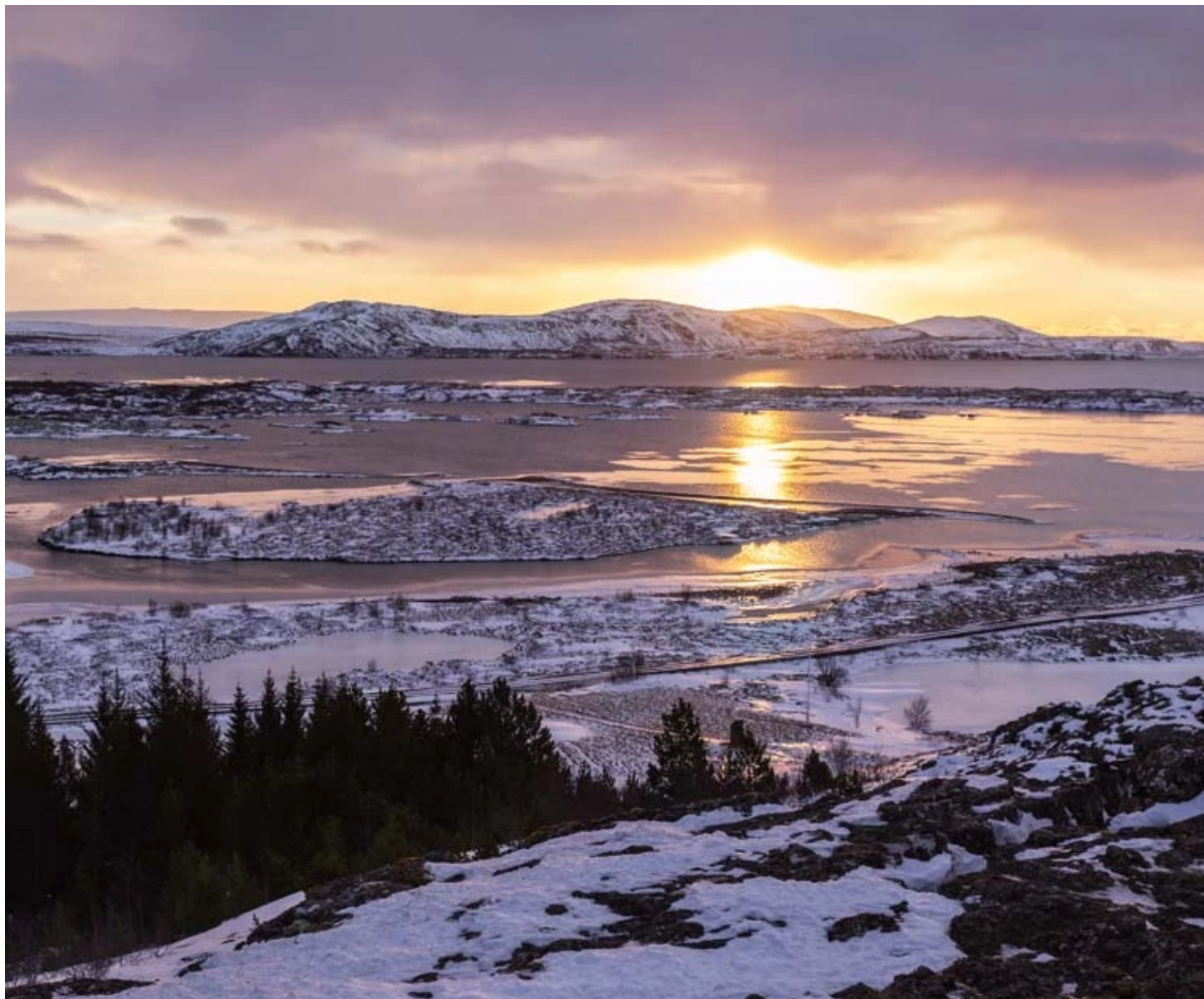
Parc national de Thingvellir