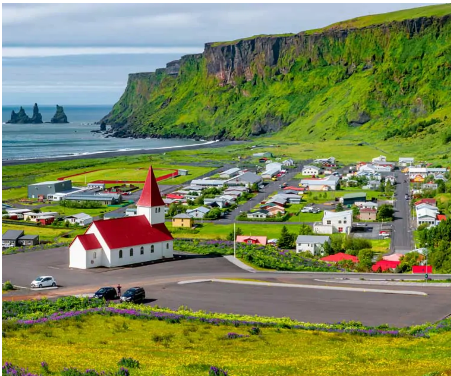
Vik i Myrdal