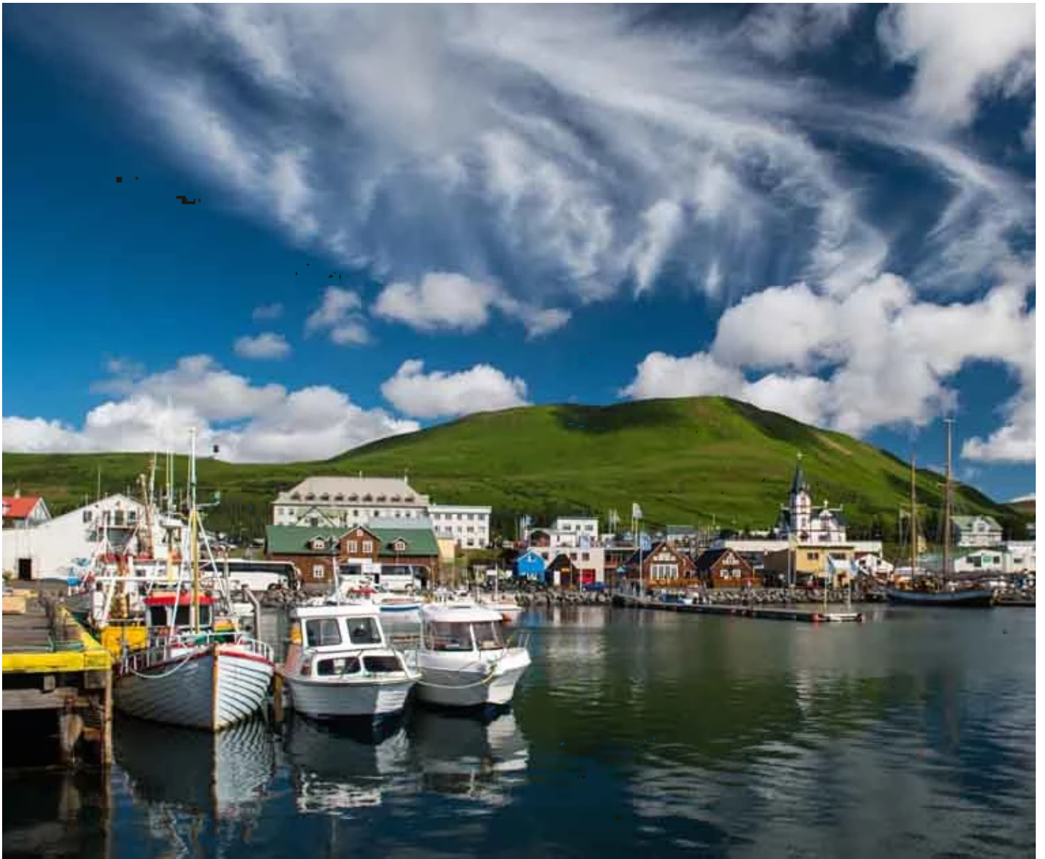
Port de Husavik