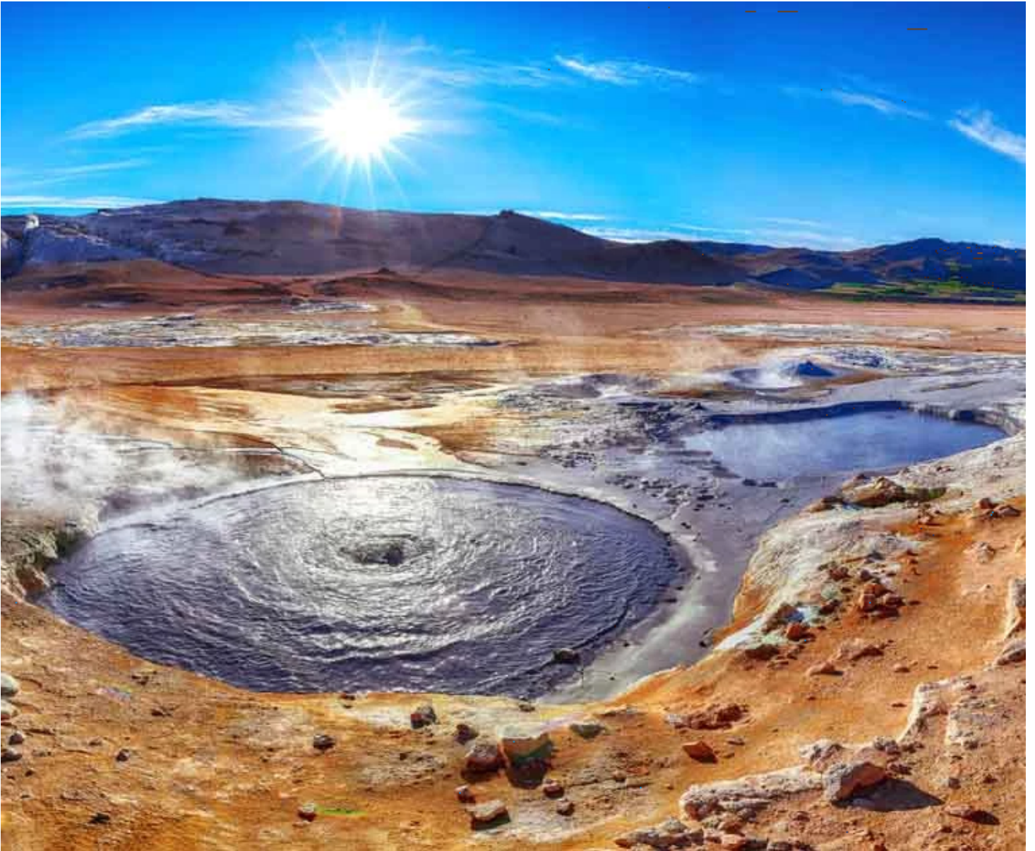
Namaskard (ou Hverir)