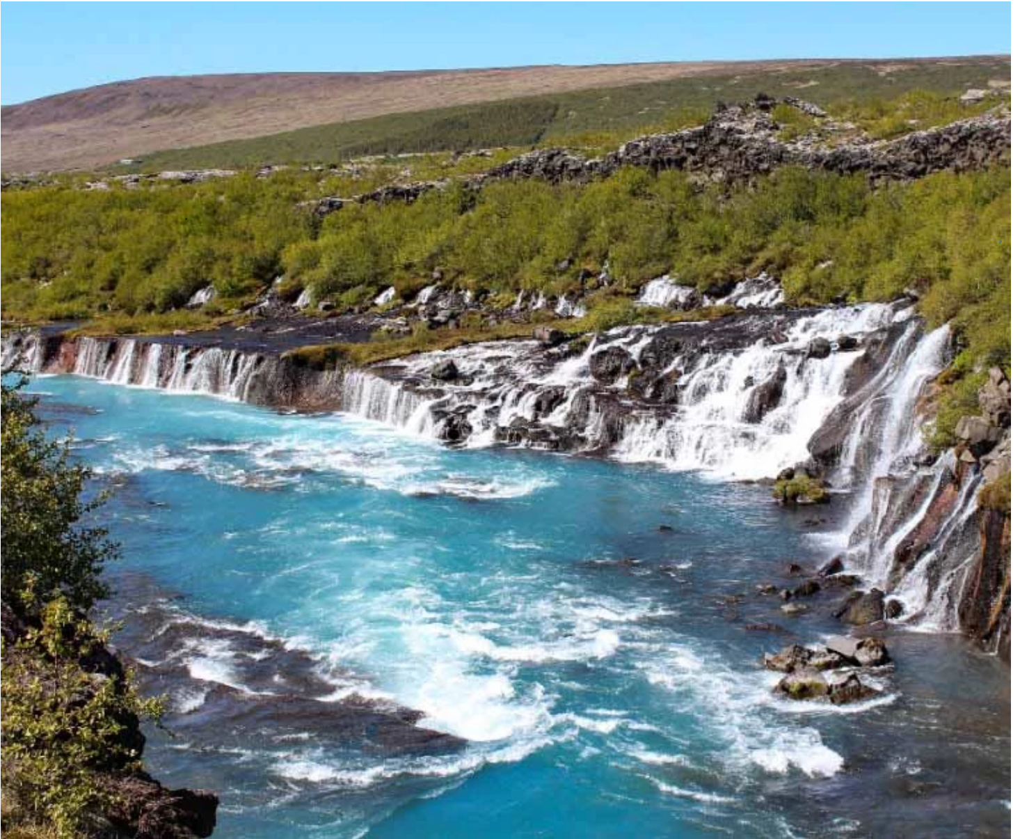
Cascades Barnafoss et Hraunfossar