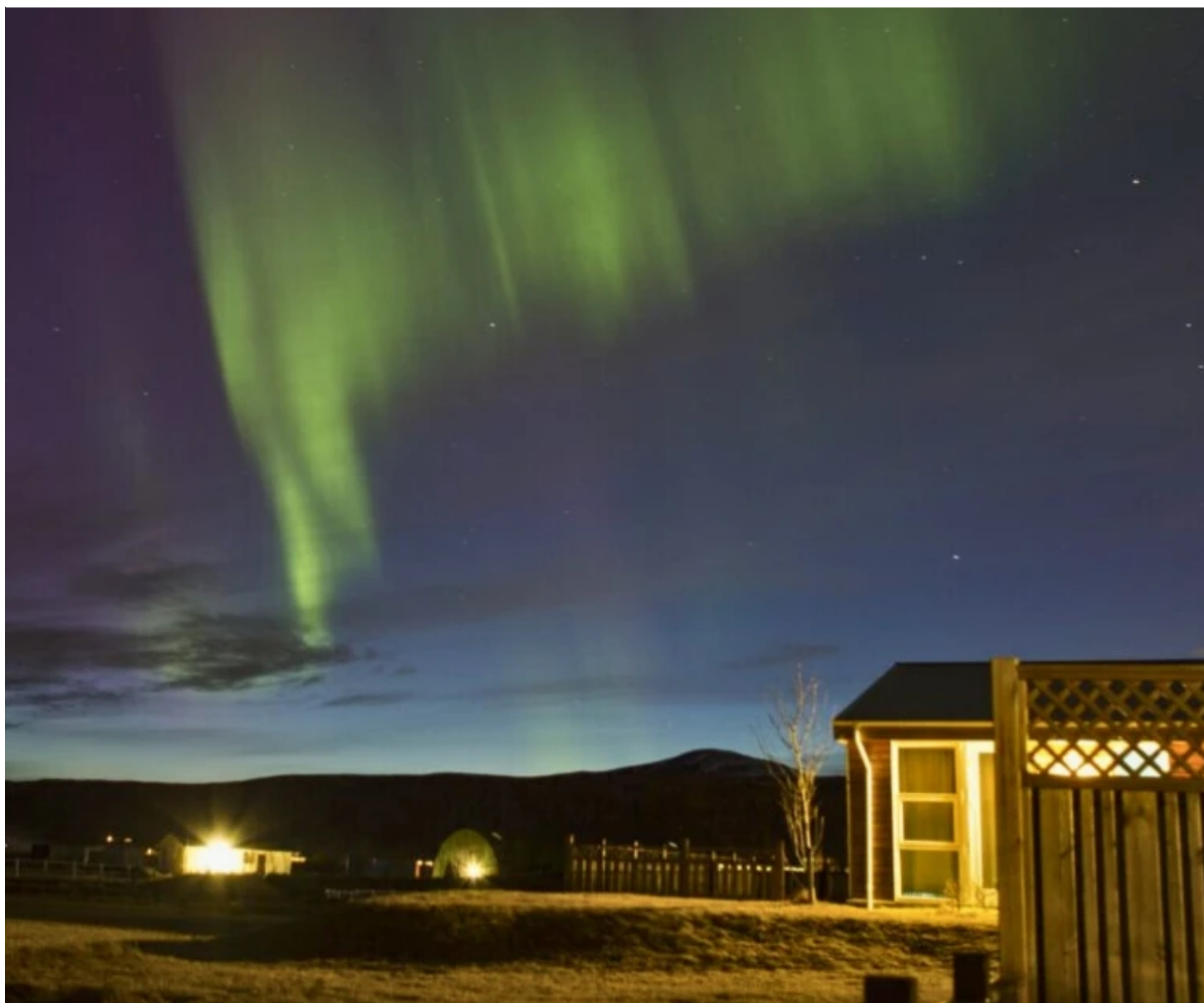
Aurores boréales devant l'hôtel Eldheistar