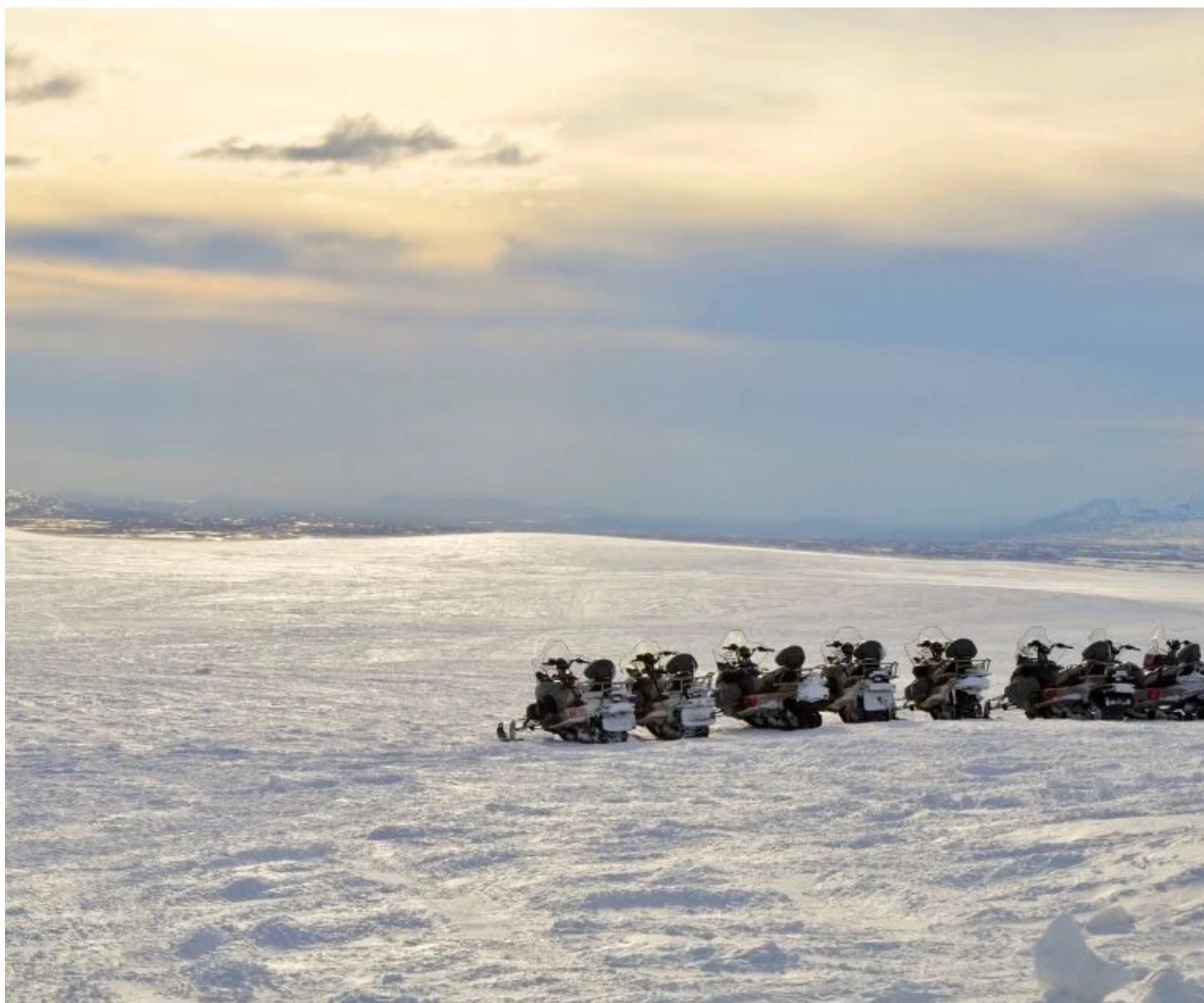
Motoneiges sur le Langjokull